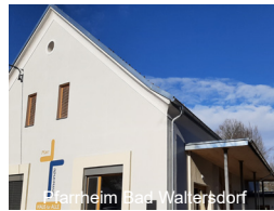
Pfarrheim Bad Waltersdorf